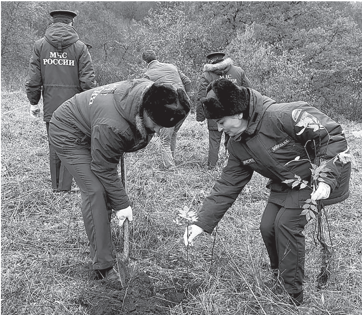
В акции «Сохраним лес» приняли участие более двухсот человек, в числе которых представители различных ведомств и волонтеры

— Вы удивитесь, но многогранный аналог — это далеко не экологически идеал, ведь при производстве одной стандартной искусственной ели в атмосферу выбрасывается около 40 кг углекислого газа! Для сравнения, натуральное дерево, выращенное в специализированном питомнике, за время своего роста, наоборот, поглощает CO 2 , а