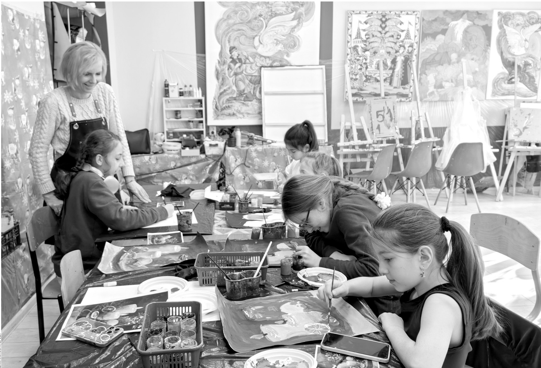
В Центре культурного развития им. Ю. А. Гагарина в Черкесске каждому ребенку найдется занятие