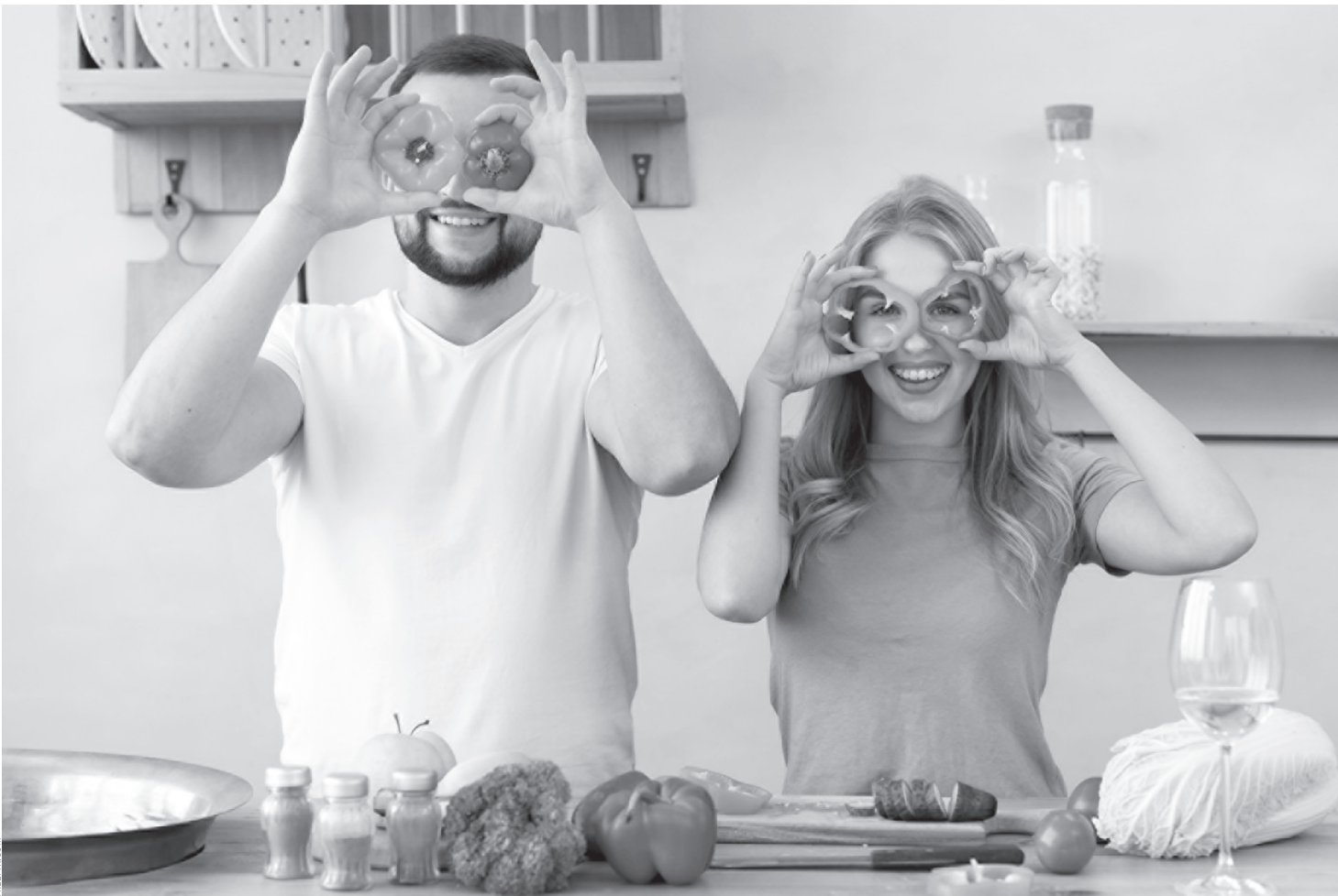
Половину вашего суточного рациона должны составлять овощи, фрукты и зелень

Решив перейти на здоровое питание, многие люди первым делом начинают считать калории — по принципу «чем меньше, тем лучше». Итог — недостаток питательных веществ, а в перспективе — срыв и переадаптация. Калорийность, конечно, важна: постоянно превышая свою норму, вы неминуемо наберете вес, а если долго будете недоедать, то похудеете. Однако точно предсказать скорость этих процессов не получится, поэтому подсчет никогда не бывает точным, а имеет лишь ориентировочный характер. Во-первых, энергетическая ценность продуктов определяется математически, без химического анализа — чаще всего берется рецепт продукта, рассчитывается количество белков, жиров и углеводов, эти показатели умножаются на калорийность 1 г каждого нутриента и суммируются. Во-вторых, все органические вещества усваива-