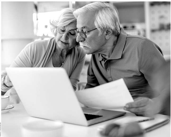
С января пенсионеры стали получать больше

— Это очень важный и практический вопрос, который волнует многих. С 2026 года стоимость одного пенсионного коэффициента (балла) для добровольной уплаты взносов составит 65 600 рублей. Давайте разберем по пунктам, чтобы было понятно. Первое. Для чего нужны пенсионные коэффициенты? Это основные единицы, в которые переводятся все ваши пенсионные права: стаж, размер зарплаты, за которую платили взносы. Все вместе они формируют будущую страховую пенсию. Чем больше индивидуальный пенсионный коэффициент (ИПК), — тем выше пенсия. Сколько их необходимо для назначения пенсии? В 2026 году для выхода на страховую пенсию по старости нужно одновременно выполнить два условия: иметь не менее 15 лет страхового стажа и накопить не менее 30 пенсионных коэффициентов. С каждым годом эти требования постепенно повышаются. Как пенсионные коэффициенты начисляются? В основном они формируются автоматически, когда вы работаете и уплачиваете за вас страховые взносы. Также ИПК начисляются за так называемые